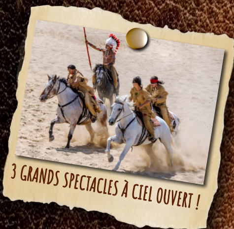
3 GRANDS SPECTACLES À CIEL OUVERT !