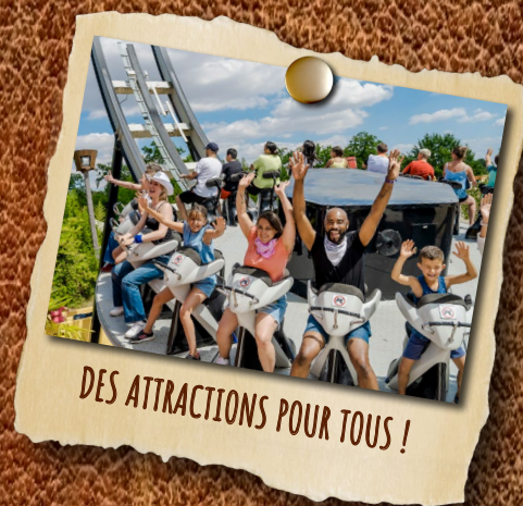
DES ATTRACTIONS POUR TOUS !