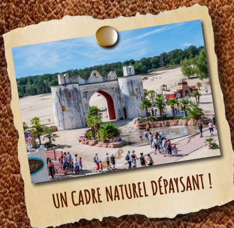
UN CADRE NATUREL DÉPAYSANT !