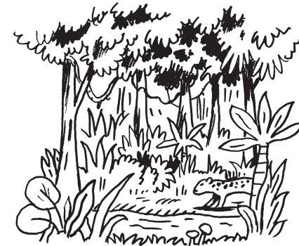
Illustration : Rémi Saillard.