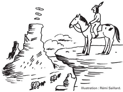
Illustration : Rémi Saillard.